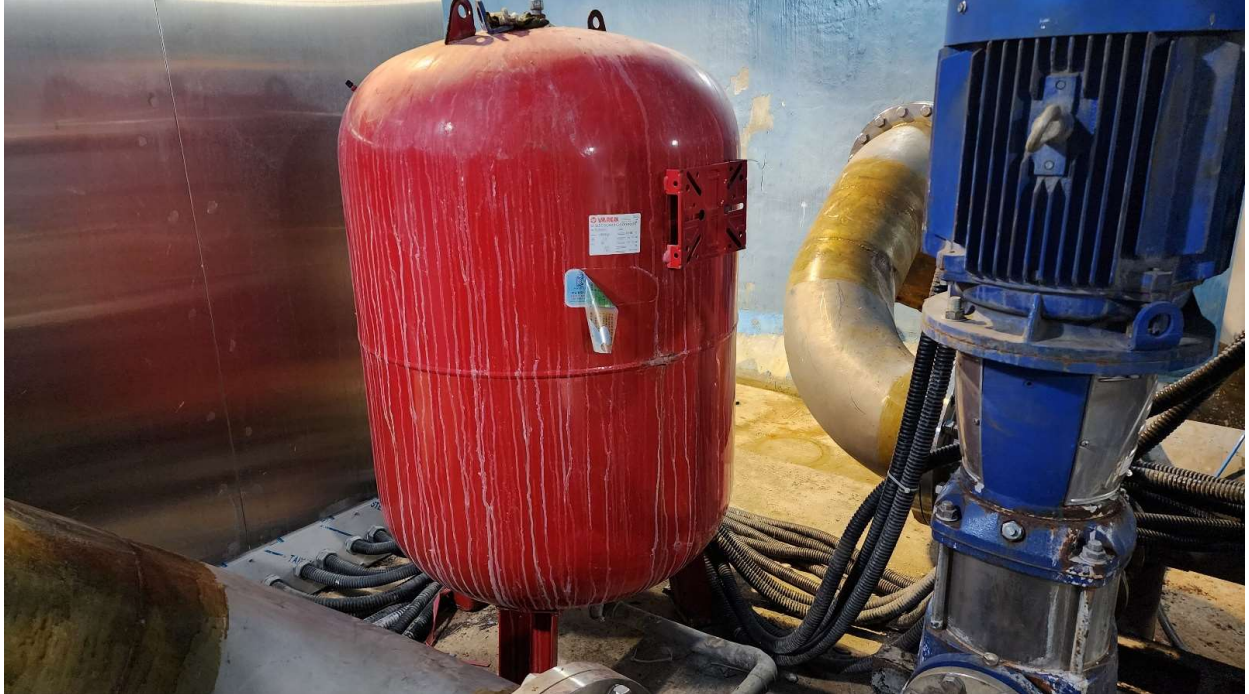
음용수펌프 압력탱크(300L 10bar)